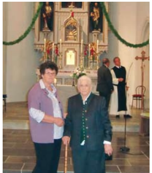
Ein ganz besonderes DANKESCHÖN geht an die Schneiderbäuerin, die es sich in ihrem hohen Alter mit ihrem Team (Damen aus Neudorf) nicht nehmen lässt, den Buchsbaumkranz für die Bartholomäer Kirche zu binden