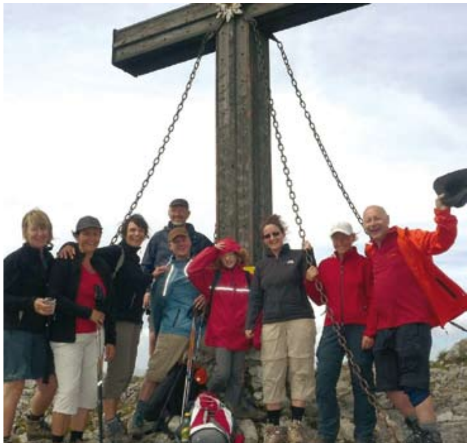
Auf der hohen Veitsch