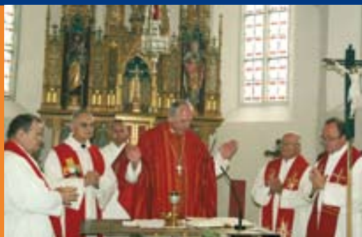
Pfarrfest St. Bartholomä und Oswaldi S. 8 und 9