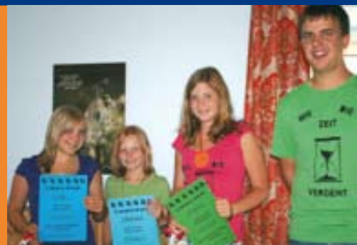
Neues von der Jungschar aus beiden Pfarren, S. 12